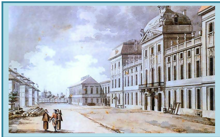
Gmach Szkoły Rycerskiej w Warszawie

3. Obiady czwartkowe to zwyczaj, jaki się przyjął na dworze Stanisława Augusta Poniatowskiego, odbywały się one raz w tygodniu, w każdy czwartek.